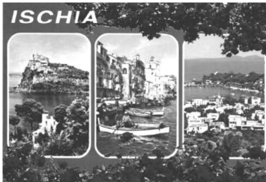
ISOLA DI ISCHIA - Un paradiso nel Mediterraneo (ed. Di Meglio)

e poesie siamo arrivate a Pozzuoli e sul battello che ci portava ad Ischia un signore, con una grossa cinepresa, mi ha chiesto in un pessimo italiano, se poteva riprendere la nostra contagiosa allegria; ci stava adocchiando da mezz'ora, e noi ben contente abbiamo fatto un po' le cretine. Il guaio è che poi è diventato appiccicoso e abbiamo faticato non poco a scrollarcelo di dosso. Arrivati finalmente sull'isola siamo stati accolti dal delizioso Agriturismo di Forio situato in mezzo ad agrumeti, vigneti, boschi e circondato da tanta pace.